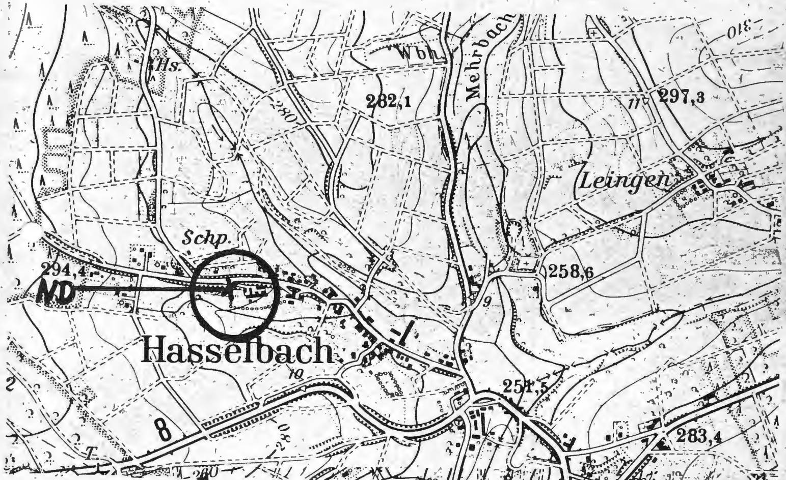
Ausschnittvergrößerung 1:10.000 aus der Top.Karte 1:25.000, Blatt-Nr. 5211 Weyerbusch Herstellung der Druckunterlagen: Landesvermessungsamt Rheinland-Pfalz, 02.07.1981